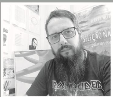
Escrito por Flávio Mello

Apoio: Secretaria Municipal de Cultura e Governo Municipal de Siqueira Campos