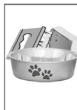
3- LAVE COM ESCOVA OU BUCHA OS POTES DE AGUA PARA OS ANIMAIS.