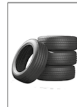
4- PNEUS SEMPRE COBERTOS.