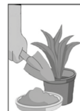
1- LIMPE SEMANALMENTE OU PREENCHA PRATOS DE VASO DE PLANTAS COM AREIA.