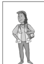
6- Atenda os agentes comunitários de saúde e agentes de endemia.