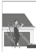
5- Não esqueça da limpeza em calhas, piscinas, ralos e em plantas tipo bromélias.