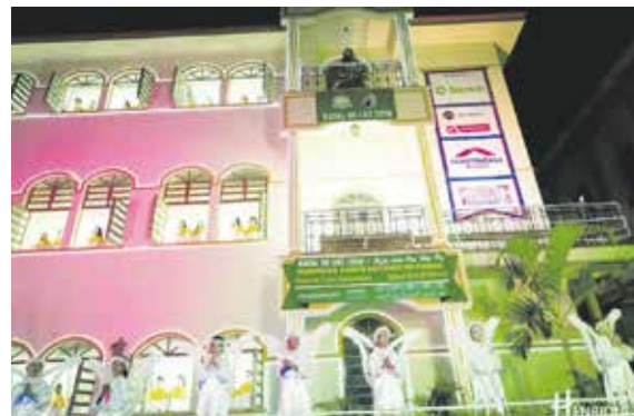
Natal de Luz