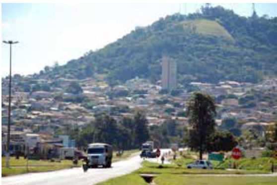
Morro do Bim

Em relação à culinária, não há do que reclamar. A cidade possui restaurantes com uma grande variedade de opções de pratos, atendendo todos os gostos. Pode-se pedir em um mesmo estabelecimento filé mignon, cordeiro, peixe, pizza, costela suína ou, ainda, hambúrguer artesanal, porções, beirute, esfihas e até caldos. A hospedagem também é de primeira. A população platinense é extremamente receptiva e há hotéis com excelente classificação para hospedar visitantes, empresários e turistas de todos os lugares do mundo.