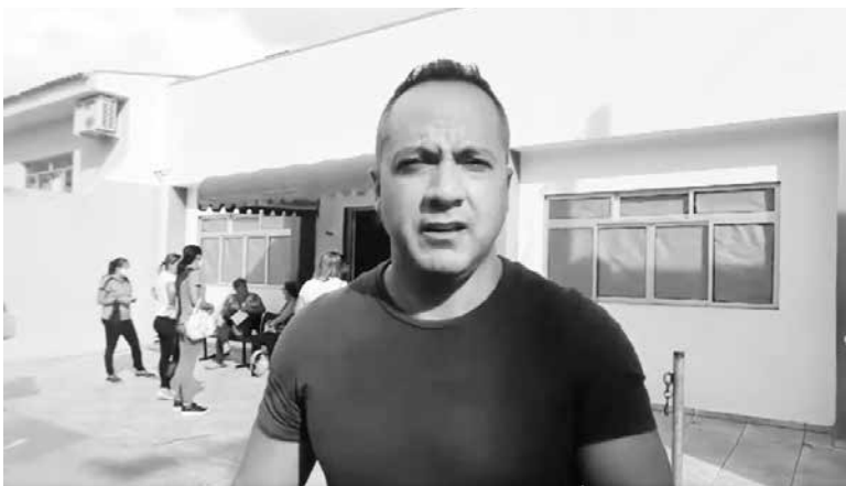
Vereador esteve acompanhando a situação de pacientes na Farmácia do SUS

tura que estão em estado de abandono estacionado aos fundos do Centro Municipal de Administração. Local que, inclusive, foi cenário de um incêndio. “É um problema que já vem de outras administrações, mas já que não tem condições mais de rodas, deveriam fazer um leilão destes veículos e utilizar a verba arrecadada para investir na área da Saúde como aquisição de exames, medicamentos, atender a população que já está faz tempo na fila de espera. Peço ao Poder Público que cuide mais do dinheiro do nosso povo”, destacou o vereador.